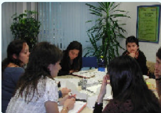
Jornada de trabajo en las Kontsumo Gelak

La realidad de ambos Centros de Formación de Consumo, así como la descripción de los intercambios y las propuestas de futuro, serán recopilados en una publicación elaborada por la Escola del Consum y Kontsumo Gelak.