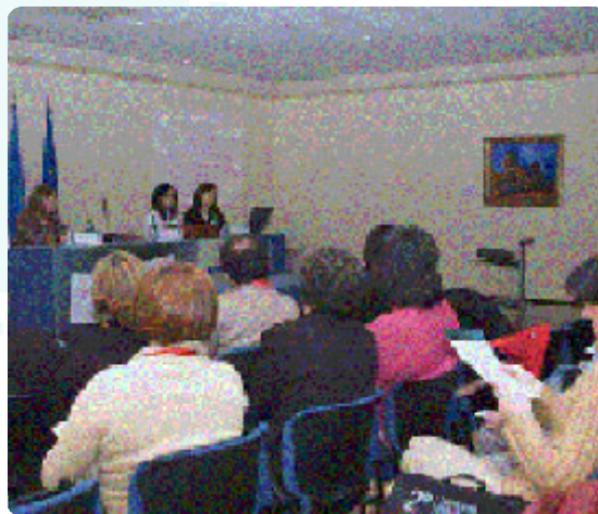
Ponencia del II Encuentro Estatal de Centros de Formación al Consumidor

La exposición e intercambio de experiencias con el resto de Comunidades Autónomas resultó muy enriquecedora, ya que fue un foro desde el cual se debatieron y consideraron nuevas y diferentes formas de trabajar el consumo con los diferentes colectivos que conforman el tejido social.